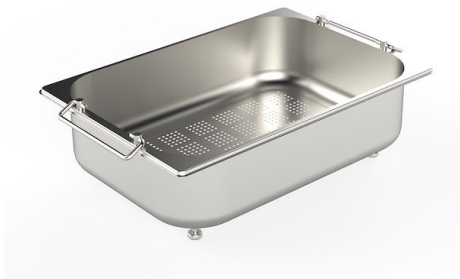
CUVETTE PERFOREE INOX A154 F00

* uniquement en combinaison avec l'accessoire A644 F04